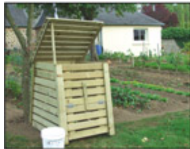
Composteurs 300 l et 600 l en vente au siège du SIRTOM

Disposez-le dans votre jardin, pas trop loin de la maison pour faciliter son utilisation. Posez le directement sur le sol, que vous aurez préalablement griffé, à l'abri d'une exposition trop importante au soleil et au vent. Ainsi votre compost ne sera ni trop sec, ni trop humide.